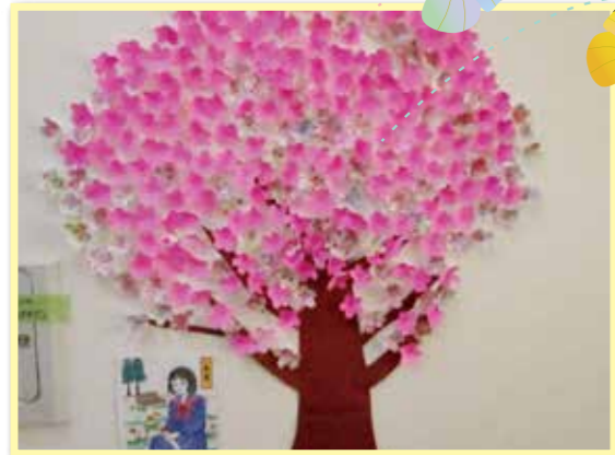
桜の壁飾り、綺麗でしょ♪