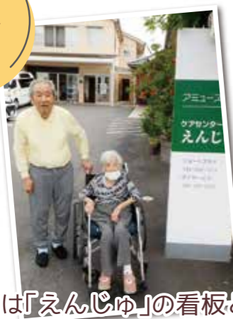
まずは「えんじゅ」の看板と