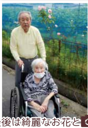
最後は綺麗なお花と