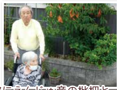
次にえんじゅ産の枇杷と