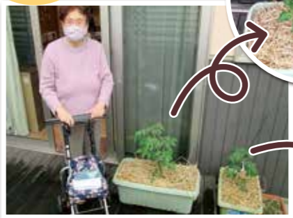
えんじゅ産ミニトマト「美味しくなりますよ〜に！」