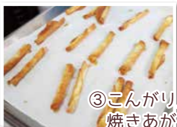
③こんがり良い色に 焼きあがりました