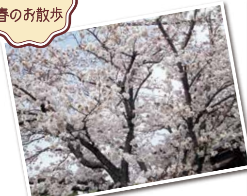
近所のお家の桜が満開でとても綺麗でした！