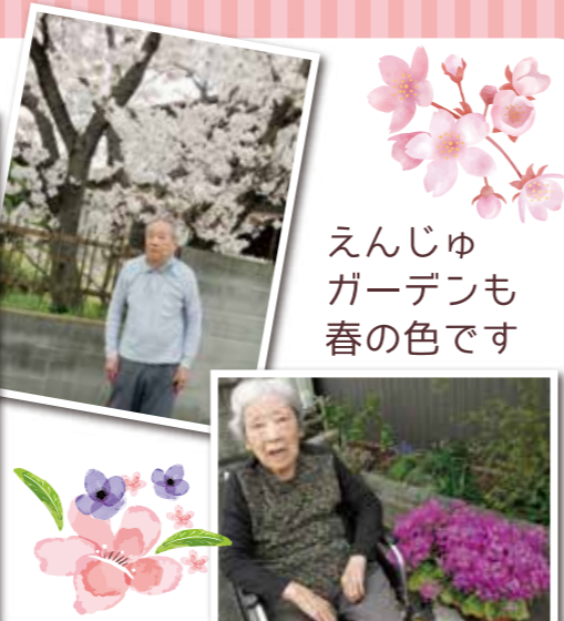
えんじゅ ガーデンも 春の色です