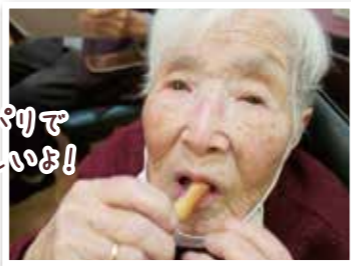
パリパリで おいしいよ！