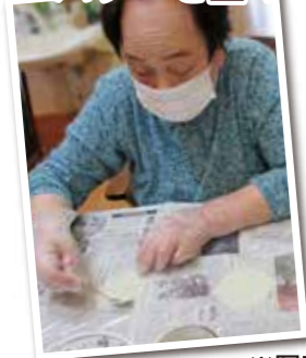
①餃子の皮に バターを塗ります