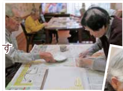
②砂糖をまぶしたら クルクル巻いて～